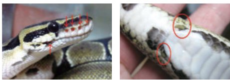
写真2:ピット器官(赤矢印) 写真1:ちいさな後ろあし(赤丸)

今日はこのへらいさー! これからも何か動物や自然の話をお届けしたいと思います。イベントや講話のご依頼も随時受け付けておりますのでお気軽にご相談ください。