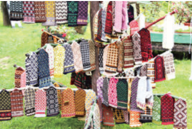
防寒のみならず様々な儀式の小道具でもあるミトン