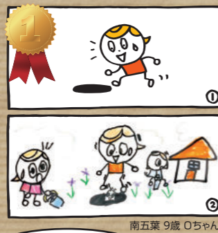
南五葉 9歳 〇ちゃん

今かい だい 今のお題 カエルの巻 今回もお題を用意したのでオチを考えてみてください!!! カエルに注目するとオチが考えやすいかも? 水に入るかな? それとも何か出てくるかな? 多分こうなるかなーとみんなが思う事と少し違う事を考えると面白い作品が出来るよ。楽しいオチ待ってまーす!!!