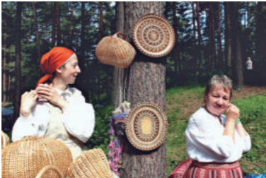
民族衣装を着て手作りのバスケットを販売中

近ではファッションナブルなアイテムでも多用されています。素材を大切に、色合いや柄で味付けされ、きちんと仕上げられた品々は日々使うだけで温かい気持ちになります。観光地として見どころ満点のラトビア、ご旅行の際にはとっておきの一品探しもお楽しみください。