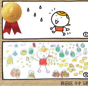
長田区 9才 5君